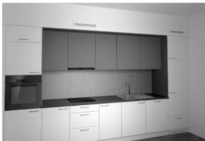
Images de synthèse