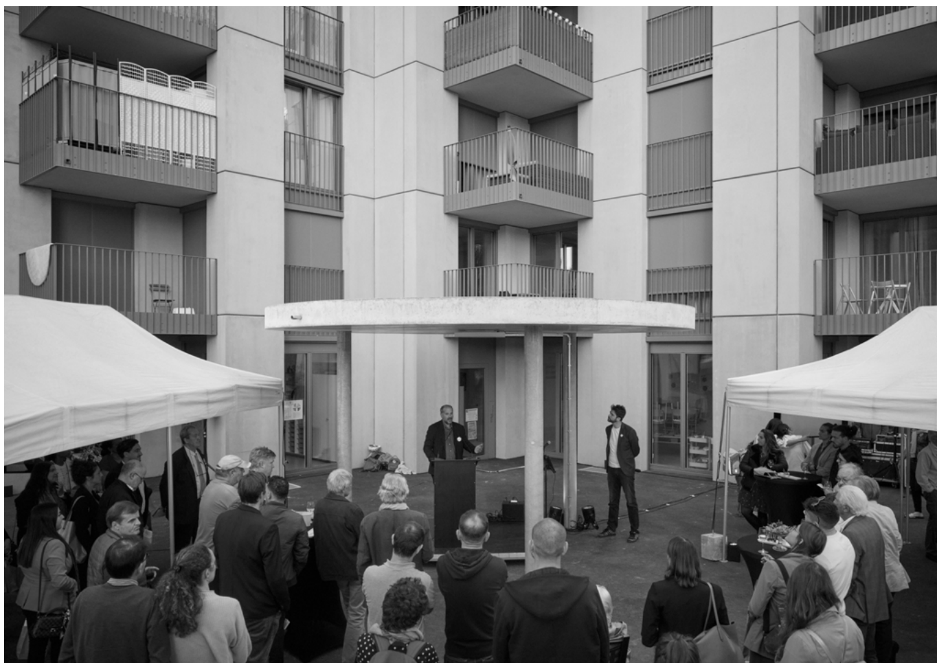
Inauguration du bâtiment, 30 septembre 2021

En effet, le budget initial de CHF 28 600 000.- a été respecté. Le décompte final est attendu pour le printemps 2022.