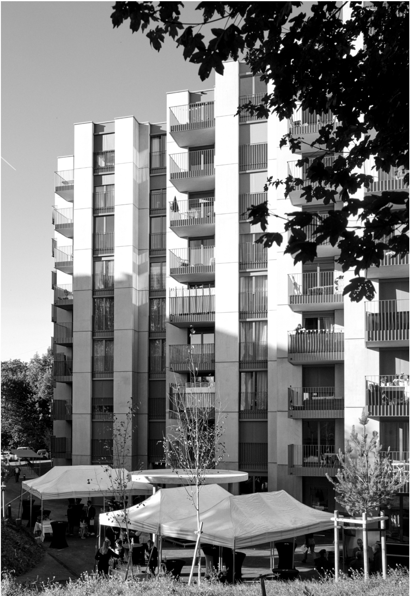
Inauguration du bâtiment, 30 septembre 2021