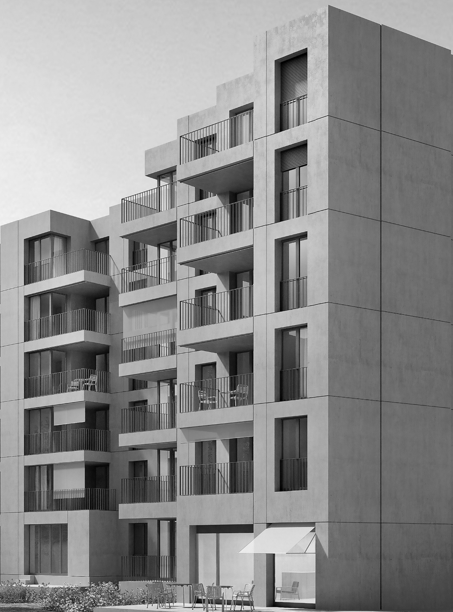
Image de synthèse, Métamorphose