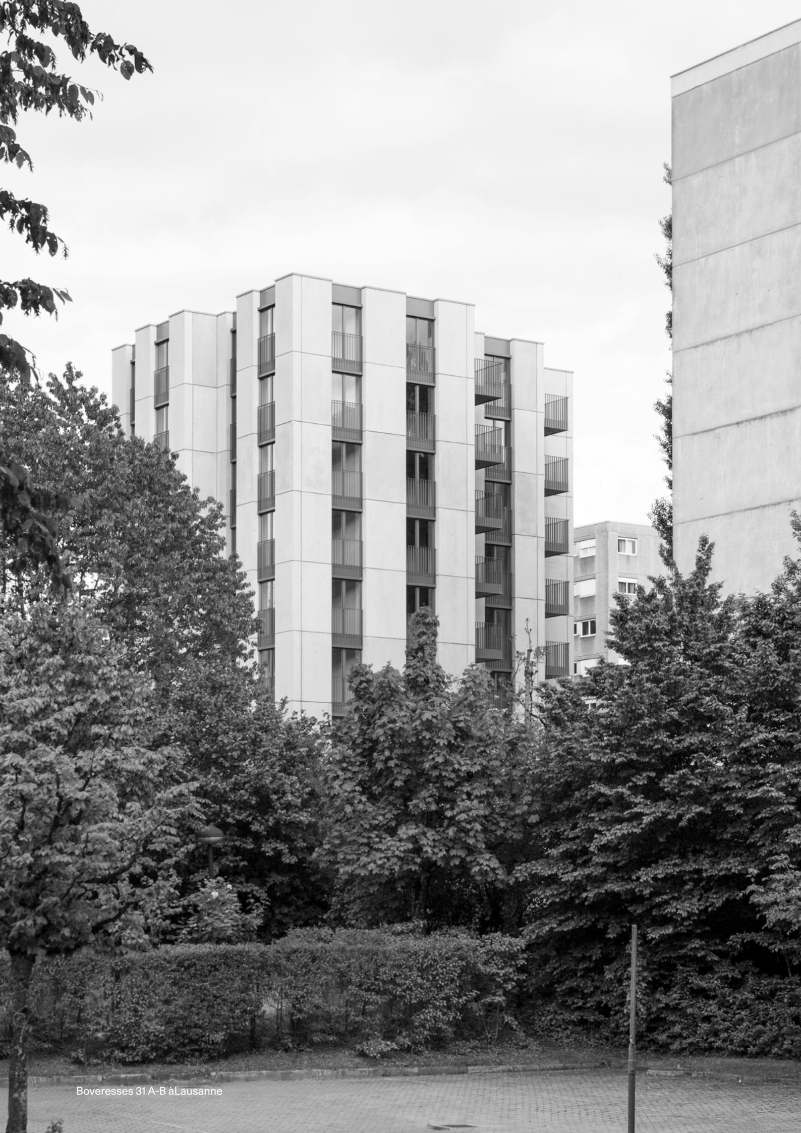
Boveresses 31 A-B à Lausanne